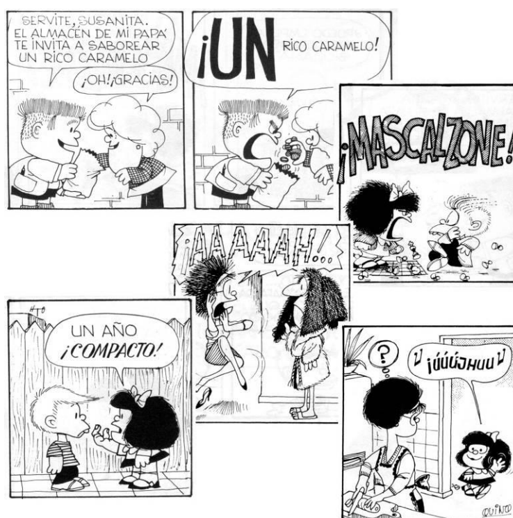
Ejemplos en la historieta "Mafalda" de Quino.

letras en la historieta "se ha especializado en el arte de destacar las calidades de la voz y de la palabra: la entonación, los titubeos, los tartamudeos, el acento, el timbre, los efectos de sobreimpresión, el refunfunar, los cuchicheos, los suspiros, etc. La forma de las letras, su disposición y su grosor evocan los atributos citados mediante una serie de figuras que, a través de su imagen, se aproximan a lo que experimenta oyendo el auditorio. Las letras descienden si la voz desciende, se hacen más gruesa y más negras si aumenta la intensidad, se desdoblán con ocasión de balbuceos y tartamudeos, se repiten para marcar la duración de la emisión, se vuelven temblorosas para indicar el miedo, se erizan de puntas o se rodean de líneas confusas para señalar la cólera; (...) etc."